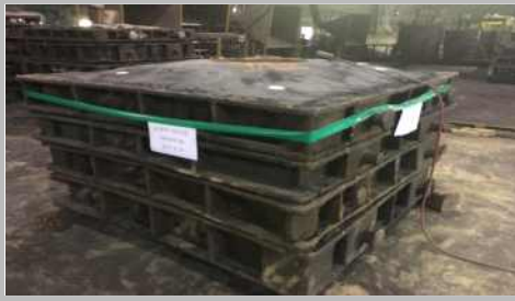
< 작업 주형 >