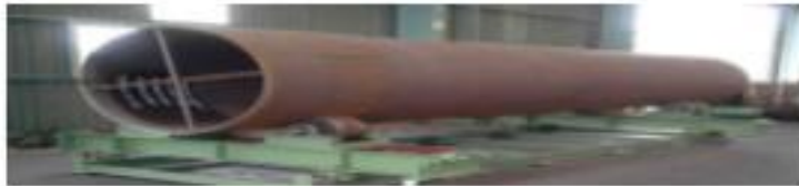
< 터닝롤러 고정용 지지대 및 앵크볼트 사용(예) >